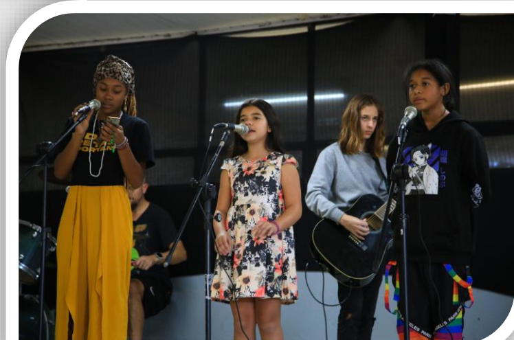
CORAL DE LATAS DA ESCOLA