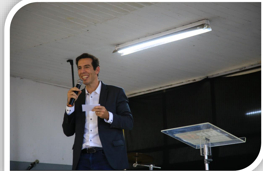
Renato Feder – Secretário da Educação / SEDUC-SP